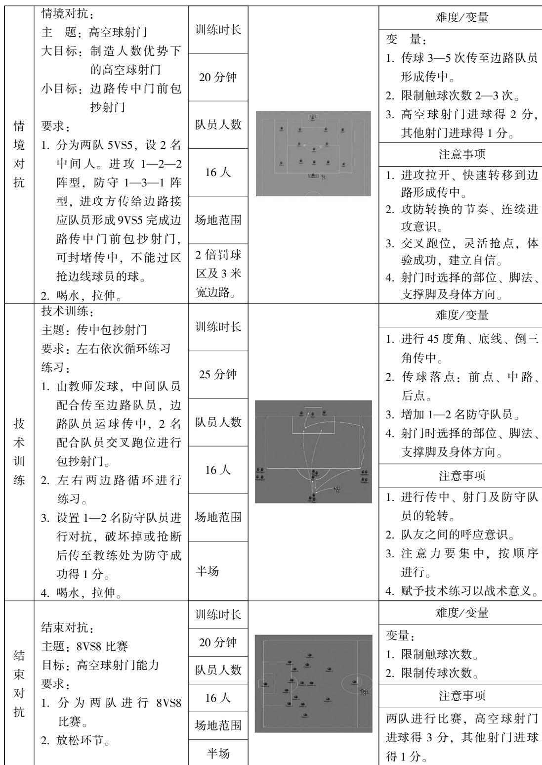
图 3 足球高空射门能力培养教案