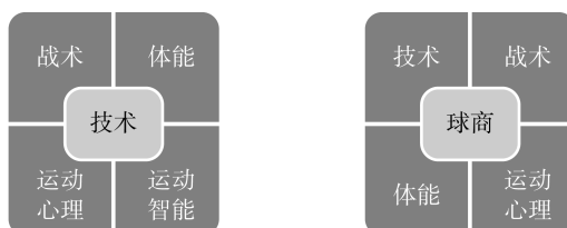
图1 以“技术”和“球商”为主导的训练理念

从整体上看，我国足球教学与训练依然难以摆脱技术主导的模式，采用的主要范式是灌输式或填鸭式。在进行教学设计时，强调“模仿—重复—强化”的过程，注重通过“刺激—应答”进行强化，难以解决学生在比赛中技术使用能力（球商）不足的问题，导致在比赛中观察选择、决策协同、应变能力以及创造能力不足，尤其是基于比赛情境的瞬间决策能力差。这需要以足球运动的本质特征与发展规律作为出发点，构建科学、适宜的教学和训练理念，以指导足球教学与训练实践（如图1所示）。