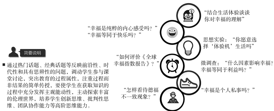
图2 “正确理解幸福”教学设计问题链