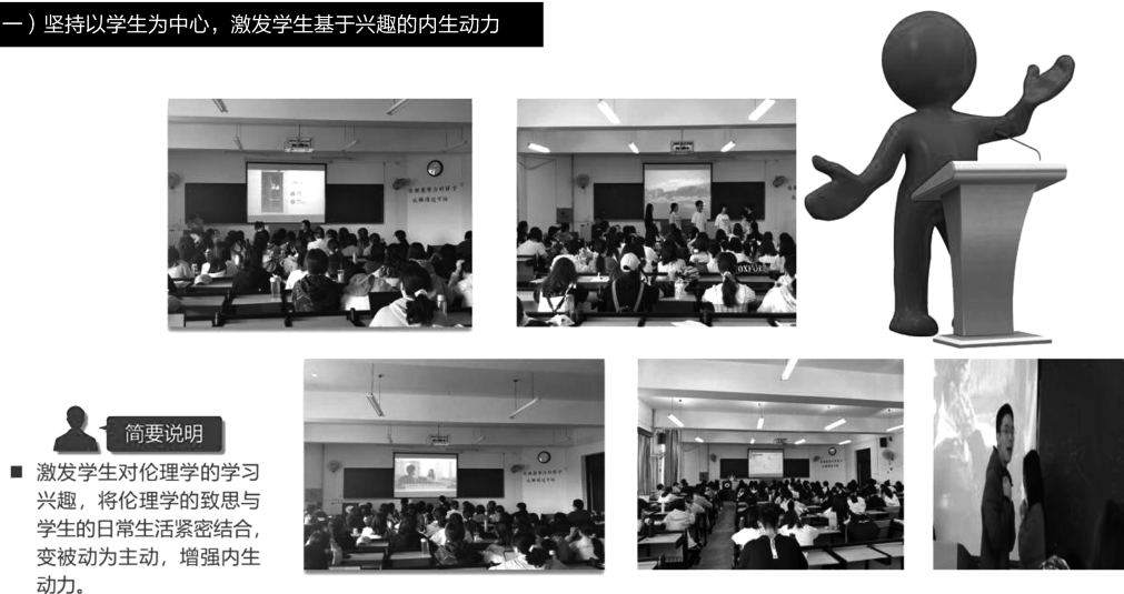
图1 2019级学生课堂伦理情景剧汇报